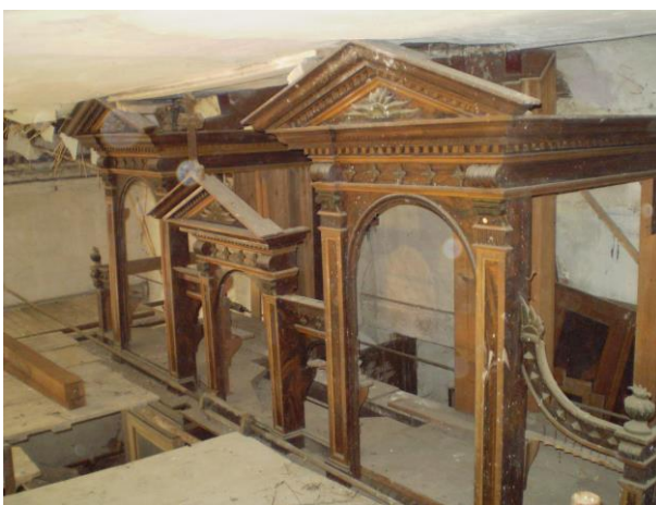
Zdenka Lněničková Hádanka z titulní strany