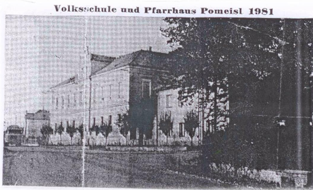
Obecní škola a fara v Nepomyšli (foto z r. 1981)

Těch prvních šťastných sedm let jejího života už má za sebou. Nyní nastoupí do druhého školního roku v Obecné škole v Nepomyšli. Tenkrát bylo horké léto, krátce před školními prázdninami a člověk se nepotí jen z toho horka, ale i z námahy učení, které pan řídící Zeischke svým žákům předloží. Jó, tenkrát patřilo totéž k velké pýše každého kantora, aby si zjednal pořádek ve své třídě a vedl mládež k pořádku. To už jsou dávno prošlé zapomenuté časy!.. Přírozeně zůstává pro pohyb těla typická tělová vůně u dětí nevyjímaje. Nejvíce to zase ucítil pan řídící u žákyně Poldi. Řekl jí, aby doma vyřídila matce, aby ona ucítí-li její intenzivní pocení, připravila pro Poldi lázeň, že jí to určitě udělá dobře! Následující den přišla Poldi do školy zase stejně ovoněná, zeptal se jí pan řídící Zeischke, zda-li vzkaz vyřídila?! Její matka odpověděla: „Řekni panu řediteli, že nemá Tebe ve škole očichávat, ale že má Tebe raději něco naučit!“