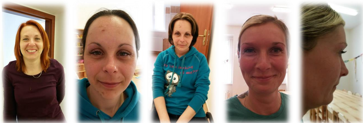
A takhle vypadaly spokojené maminky po celodenní péči a po proměně :-D.

Text: Zdenka Lněničková