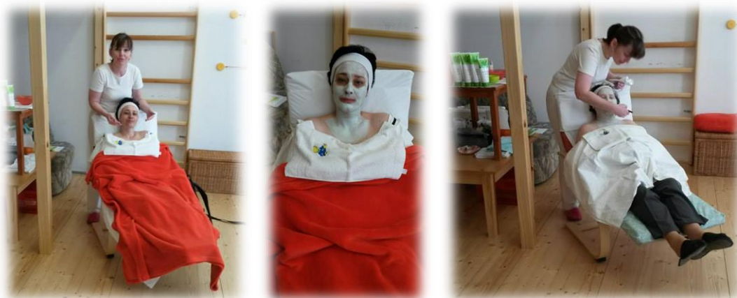
... k dispozici byla také kosmetička s přírodní kosmetikou pro péči o obličej i celý dekolt.