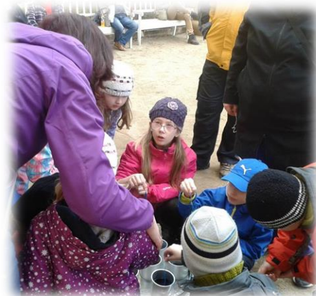
předsedkyně MC Jablíčko z Nepomyšle