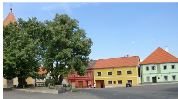
Domy čp. 81,82,83 na návsi u kostela sv. Mikuláše v r. 2012