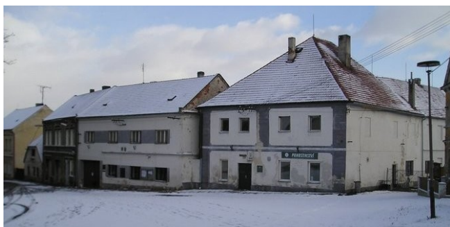
Domy čp. 81,82,83 na návsi u kostela sv. Mikuláše v r. 2008