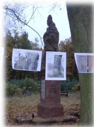
Nově restaurovaná socha sv. Prokopa na pomezí Buškovic, Nepomyšle a Vroutku