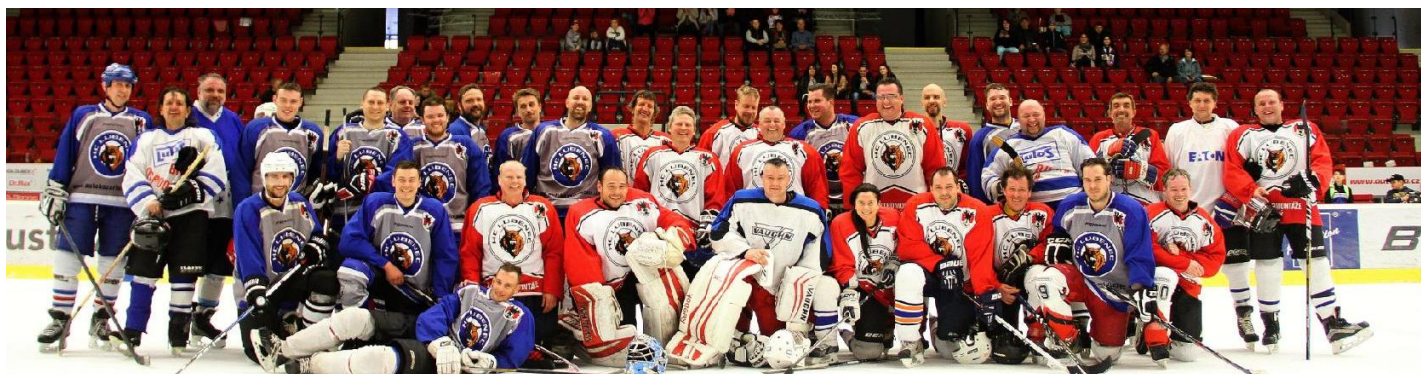
Foto ze zápasu Stará Garda HC Lubenec - HC Lubenec současnost v KV Aréně

Více najdeš na www.hclubenec.webnode.cz nebo na facebooku