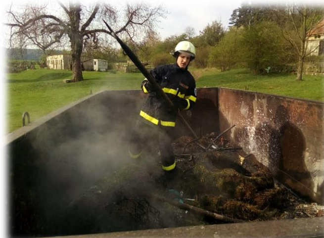
Text a foto: Vladimír Vázler