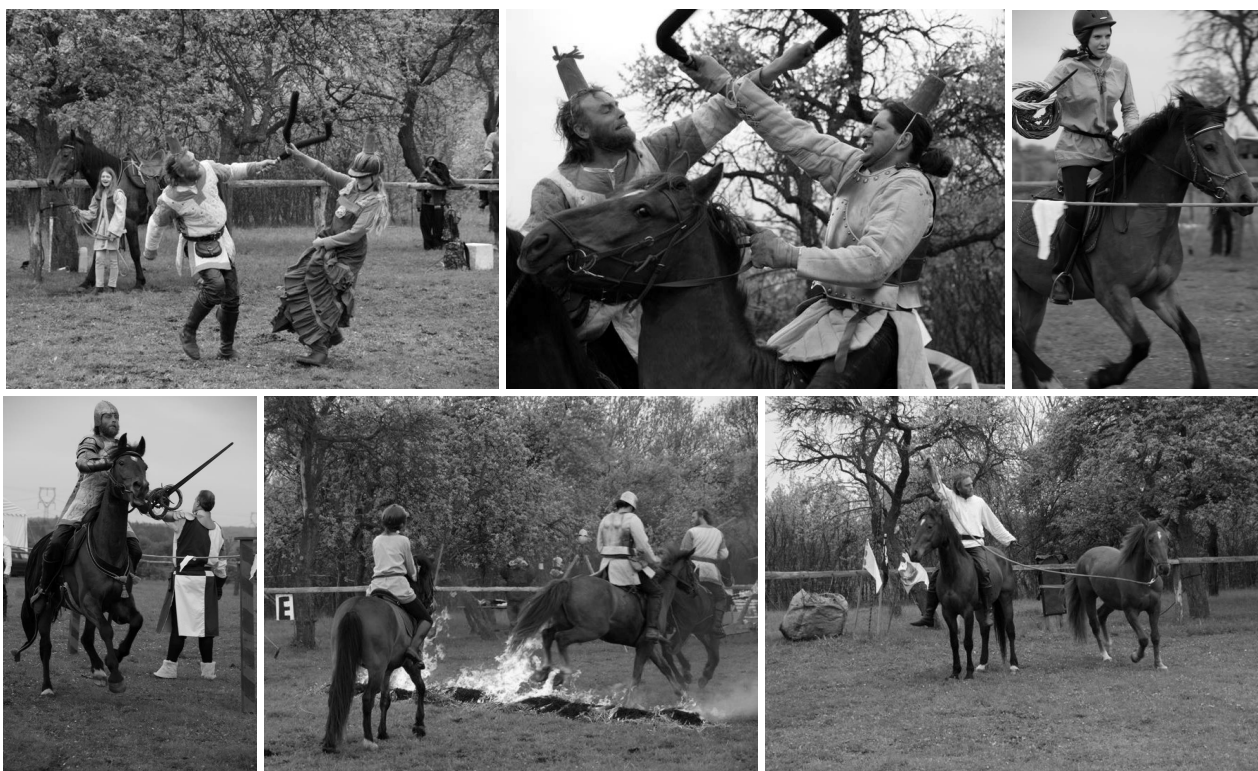
Pro lid prostý pak různé kejkle divadelní a taneční připraveny byly - tu o nenasytné šenkýřce a jejím trestu povídání, tu lepých děv tanec vábíví, tu umění voltyžerské i cvičitelské.