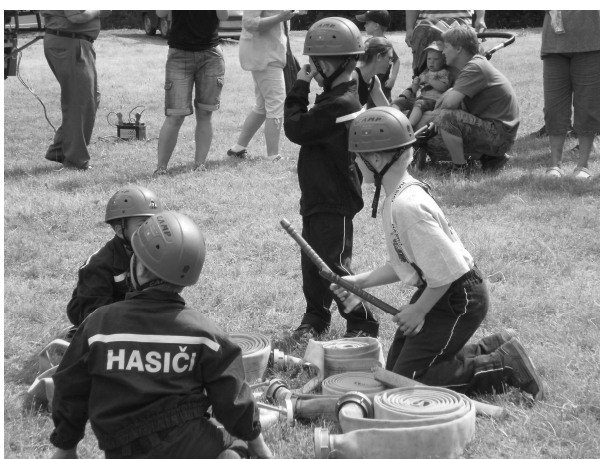
Text: Zdenka Lněničková