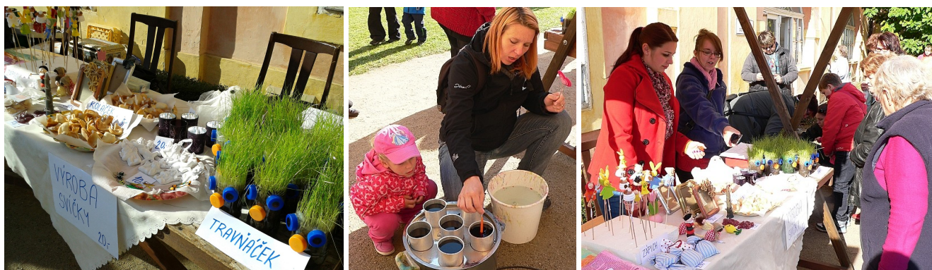
U stánku MC Jablíčko z Nepomyšle ...