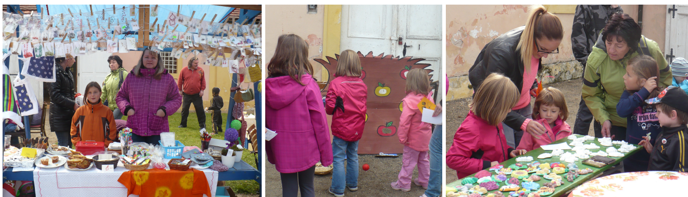
U stánku Pandíků o. s. ...